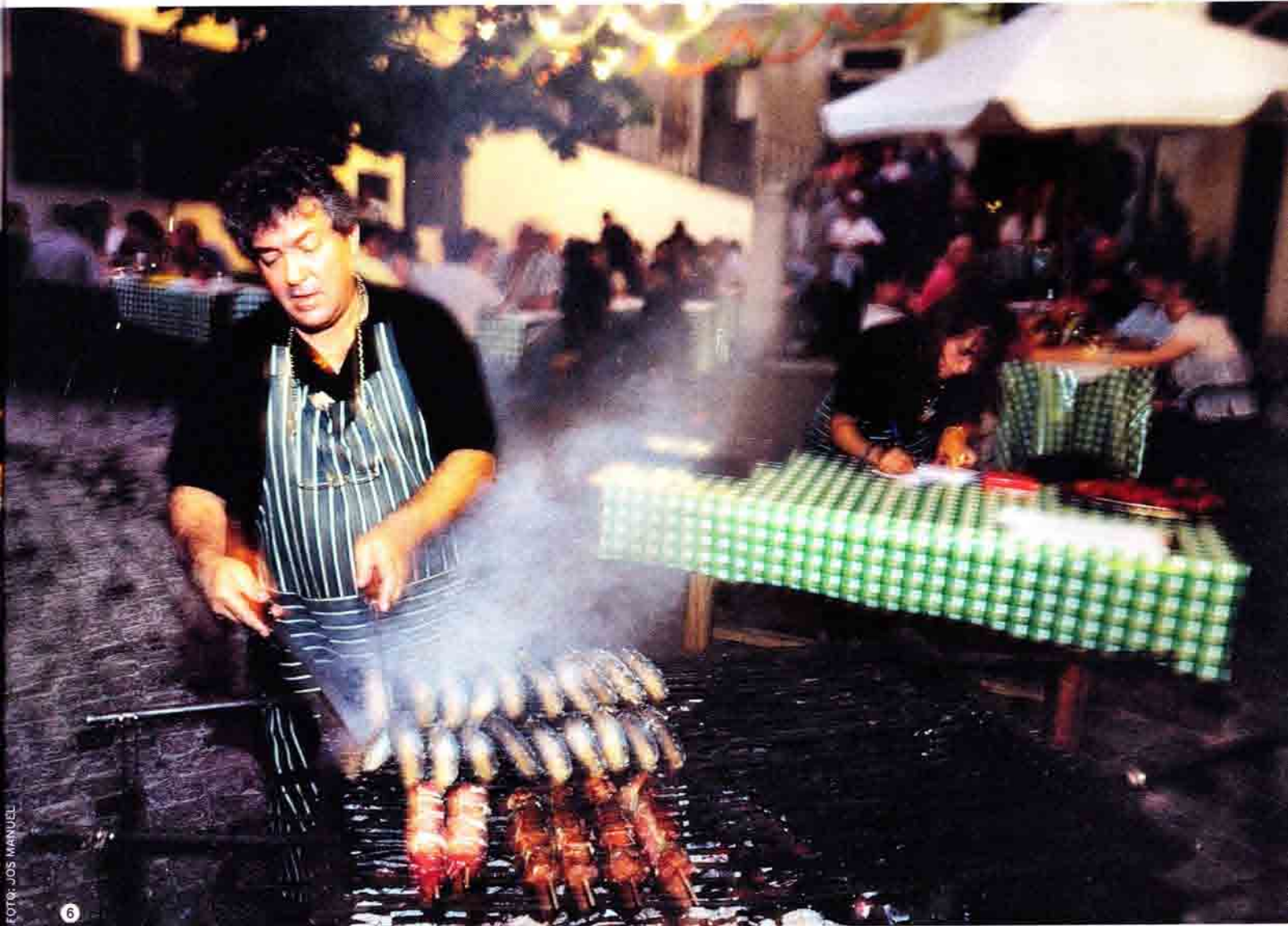
6 FOTO: JOS MANUEL TEKST: KEES BREGMAN FOTOGRAFIE: KEES BREGMAN EN PORTUGEES VERKEERSBUREAU ILLUSTRATIES: SCHWANDT INFOGRAPHICS MET DANK AAN CAMPING QUINTA DA CEREJEIRA

de Ascensor de Santa Justa, een curieus smal stalen bouwwerk uit 1902 met een lift, die naar een geweldig uitzichtpunt leidt. Van hieruit werp je een prachtige blik over de Taag en de okergele daken van Lissabon. Een echte must is ook een ritje met de Ascensor da Bica, een kruising tussen een lift en een tram uit 1892, die naar de Bairro Alto voert. Dat is een van de zeven heuvels van Lissabon - een magisch getal voor een stad die een beetje wil meetellen. Rome heeft er immers ook zeven.