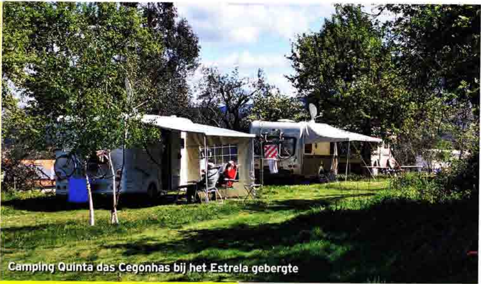
Camping Quinta das Cegonhas bij het Estrela gebergte